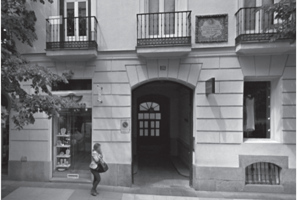
Número 25 de la calle Claudio Coello de Madrid en la actualidad. Arriba a la derecha se aprecia la placa conmemorativa recordando el fallecimiento del poeta.

A la misma hora, aproximadamente, en la calle Claudio Coello, 25, de Madrid, expiraba Gustavo Adolfo Bécquer afectado de tuberculosis. Estaba acompañado por su mujer, Casta, y por sus amigos, el gran pintor Casado del Alisal y el poeta Augusto Ferrán. Abrieron la ventana para que entrase en la habitación, donde Gustavo Adolfo había fallecido, un poco de la fresca brisa madrileña de invierno y vieron oscurecerse el cielo de pronto, como si se pusiera de luto por la muerte del poeta.