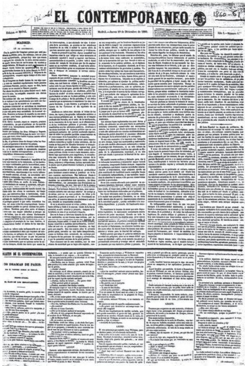
Portada del periódico El contemporáneo , donde colaboró Bécquer.

infiel y, lo que es peor, nace su tercer hijo y Bécquer siempre tendrá la duda de si verdaderamente es suyo. Regresa a Madrid a dirigir algunas publicaciones periódicas, pero las tragedias se acumulan: ha estallado la revolución Gloriosa (1868) que restaura la monarquía y se pierde el manuscrito de sus poemas... Luego llegará la muerte de su hermano y, poco después, el día del eclipse total.