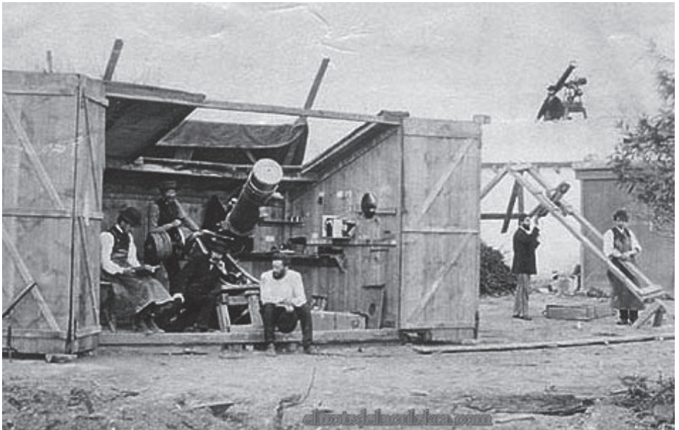
Expedición científica americana de 1870 a Jérez de la Frontera, preparándose para la observación del eclipse

El 22 de diciembre del año 1870 en Jerez de la Frontera se encontraba lo más granado de la astrofísica norteamericana, había varios científicos de la United States Coast and Geodetic Survey , principal organismo científico americano por aquel entonces. Estaban apostados en el olivar de Buena Vista, a kilómetro y medio del casco urbano hacia el nordeste. Desde buena mañana se encontraban colocando sus anteojos gigantes y sus telescopios de la época, los acompañaba un pintor que haría de reportero gráfico e inmortalizaría el momento en que la luna tapase por completo al sol, porque lo que iba a producirse a las 10.40 de la mañana era un eclipse total.